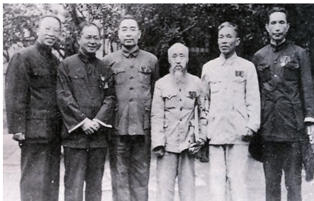
1949年9月，翦伯赞参加全国政协第一届全体会议