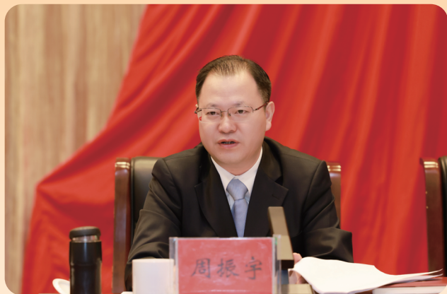
市委副书记、市长周振宇作有关说明

9月12日，中共常德市委八届七次全体（扩大）会议召开。全会深入学习贯彻习近平新时代中国特色社会主义思想，全面落实省委十二届四次全会精神，报告今年以来市委常委会的工作，安排部署下一阶段重点任务，动员全市上下锚定“三高四新”美好蓝图、加快推动高质量发展，齐心协力建设社会主义现代化新常德。市委书记曹志强代表市委常委会作工作报告。市委副书记、市长周振宇传达学习省委十二届四次全会精神并就《常德市贯彻落实〈中共湖南省委关于锚定“三高四新”美好蓝图 加快推动高质量发展的若干意见〉责任清单》作简要说明、提出相关工作要求。