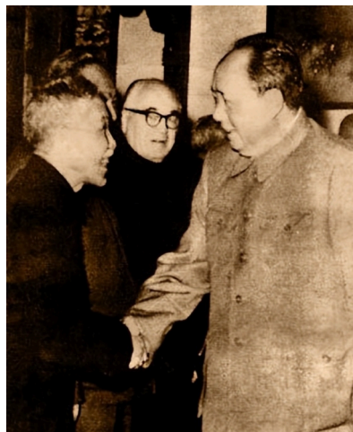
1957年3月，毛主席在中南海接见翦伯赞等部分学者代表