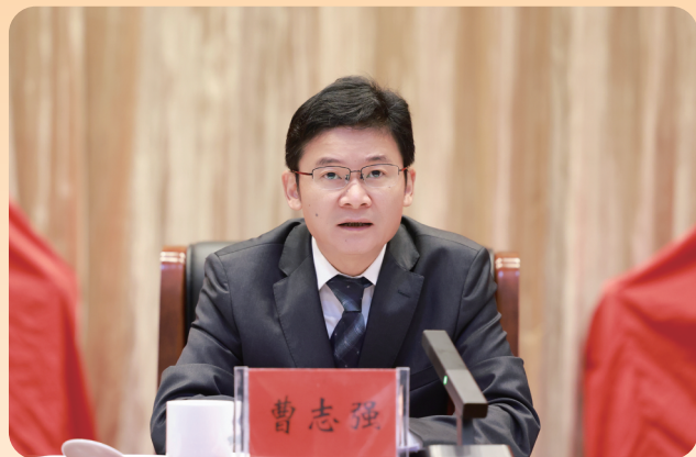
市委书记曹志强讲话