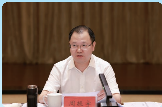
市委副书记、市长周振宇出席会议并讲话

7月10日，为期两天的全市“创新突破产业突围”流动现场会暨指挥部第二次全体会议召开。市委书记曹志强，市委副书记、市长周振宇带领各县市区、市直“六区”和市直单位主要负责同志实地观摩考察创新驱动发展和现代化产业体系建设情况，检阅各地推进创新突破产业突围三年攻坚行动取得的新进展、新成效。