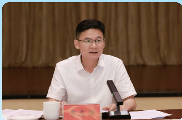
市委书记曹志强主持会议并讲话