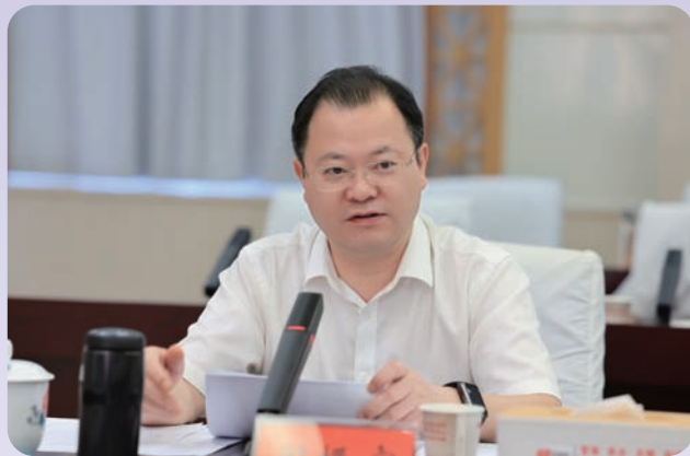
市委副书记、市长周振宇讲话

6月21日，市委市政府举办专题培训班，深入学习贯彻习近平总书记关于树立和践行正确政绩观的重要论述和严禁统计造假、严控地方政府债务风险的重要批示精神，传达学习省委省政府专题培训班精神，以上率下推动全市各级各部门更好树立和践行正确政绩观，加快实现“三高四新”美好蓝图，大力推进创新突破产业突围，加快建设中国式现代化新常德。市委书记曹志强作辅导报告。市委副书记、市长周振宇传达学习省委省政府专题培训班精神并作辅导报告。