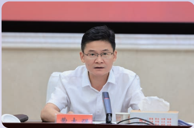
市委书记曹志强讲话