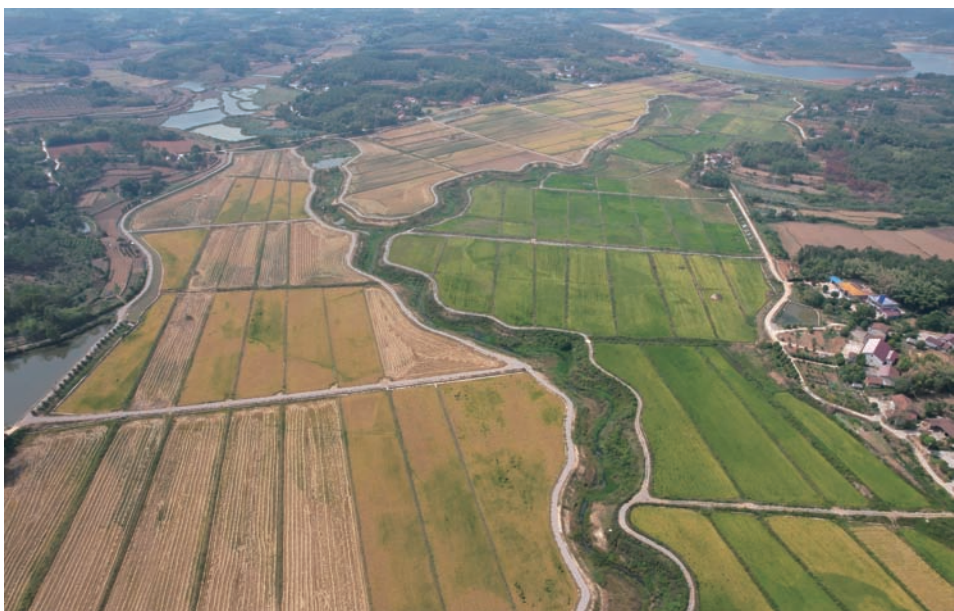
津市金坪村农田改造

集体择优进行集中流转，相比平整前每亩田每年的收益至少增加了 200 元，总收入增加近 20 万元。村里将其分为三部分，一部分作为溢价收益返还村民，一部分作为村集体收入，一部分作为工程管护资金，解决了管护难题。同时，新增土地由村集体发包，也增加了村集体收入。