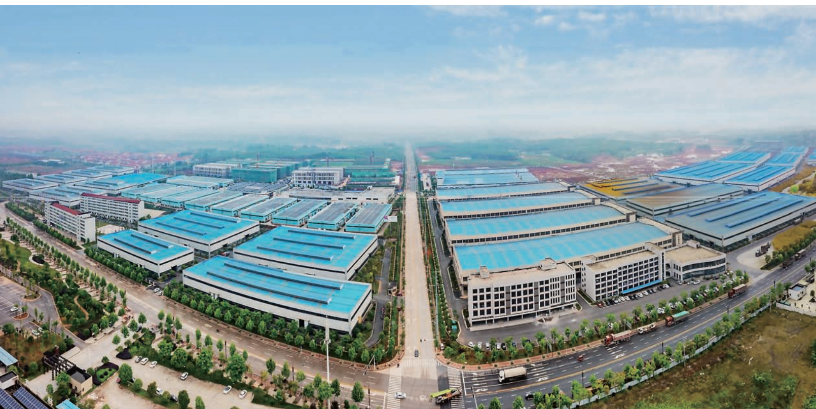
临澧智能制造产业园