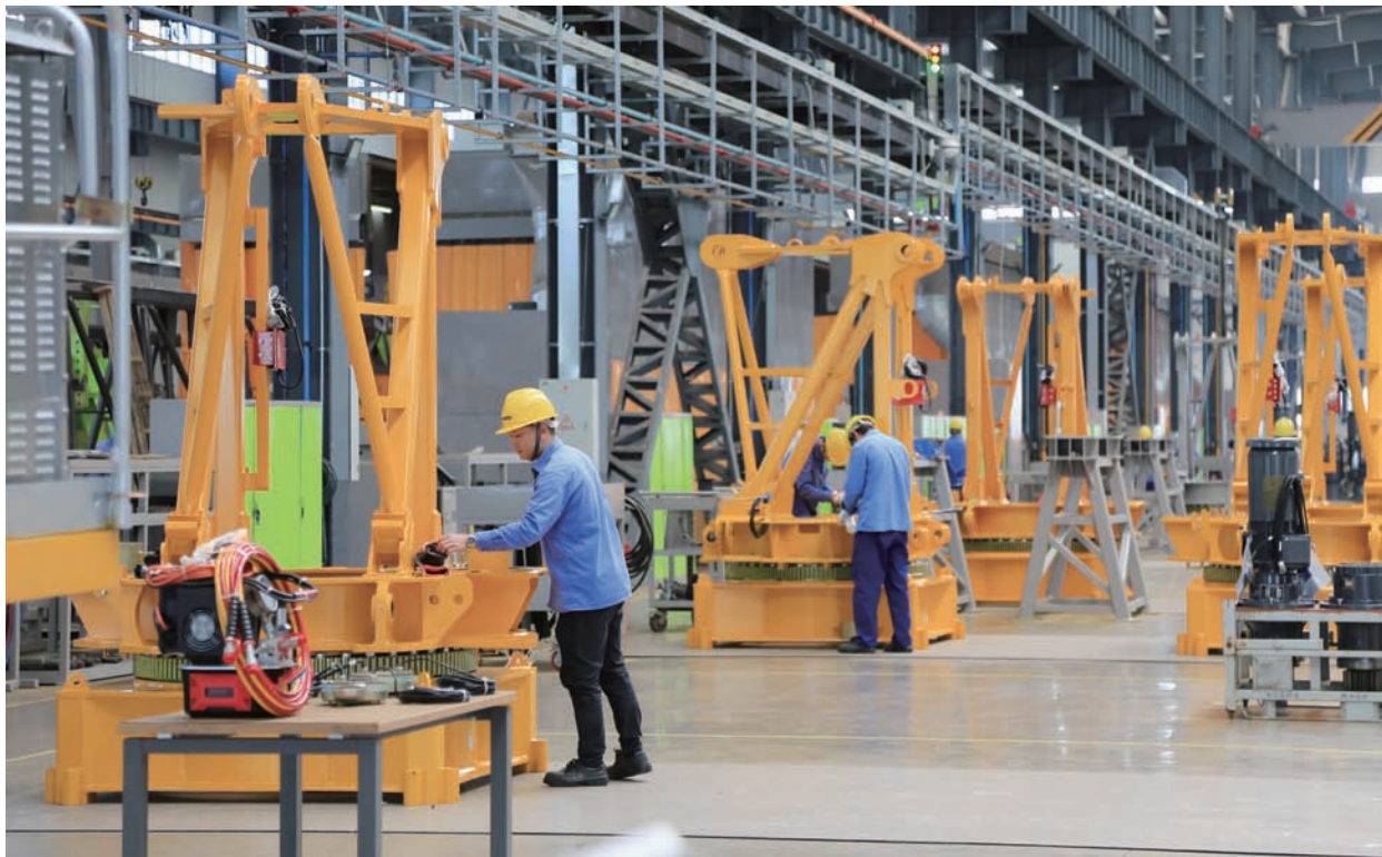
中联建起全球最大塔机制造