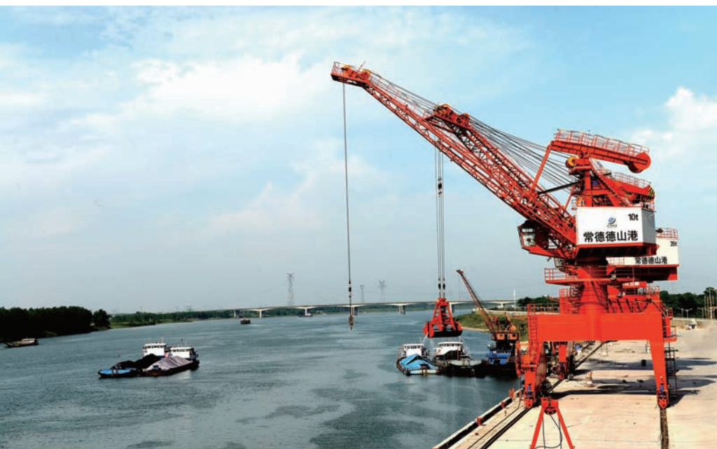
德山港区千吨级码头

大变，持续推进“深耕长沙市，对接长三角，决胜大湾区”行动，进一步创新资本招商、产业链招商、定向招商、产业园招商等方式方法，紧盯园区四大主导产业的补链延链强链，加快推动项目集中、企业集聚、产业集群，力争每年新引进亿元以上工业项目24个以上、10