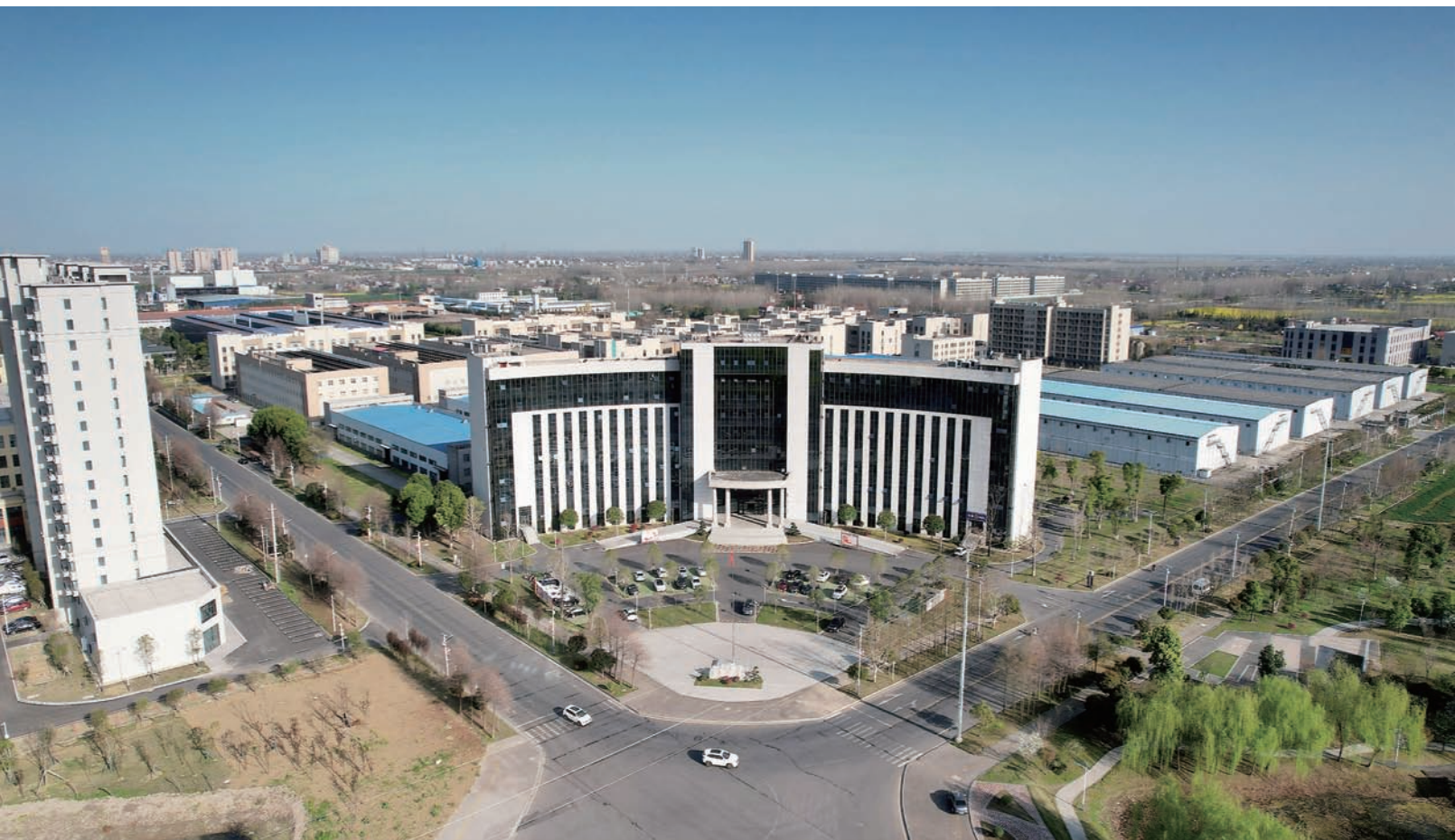
安乡高新区创新创业大楼