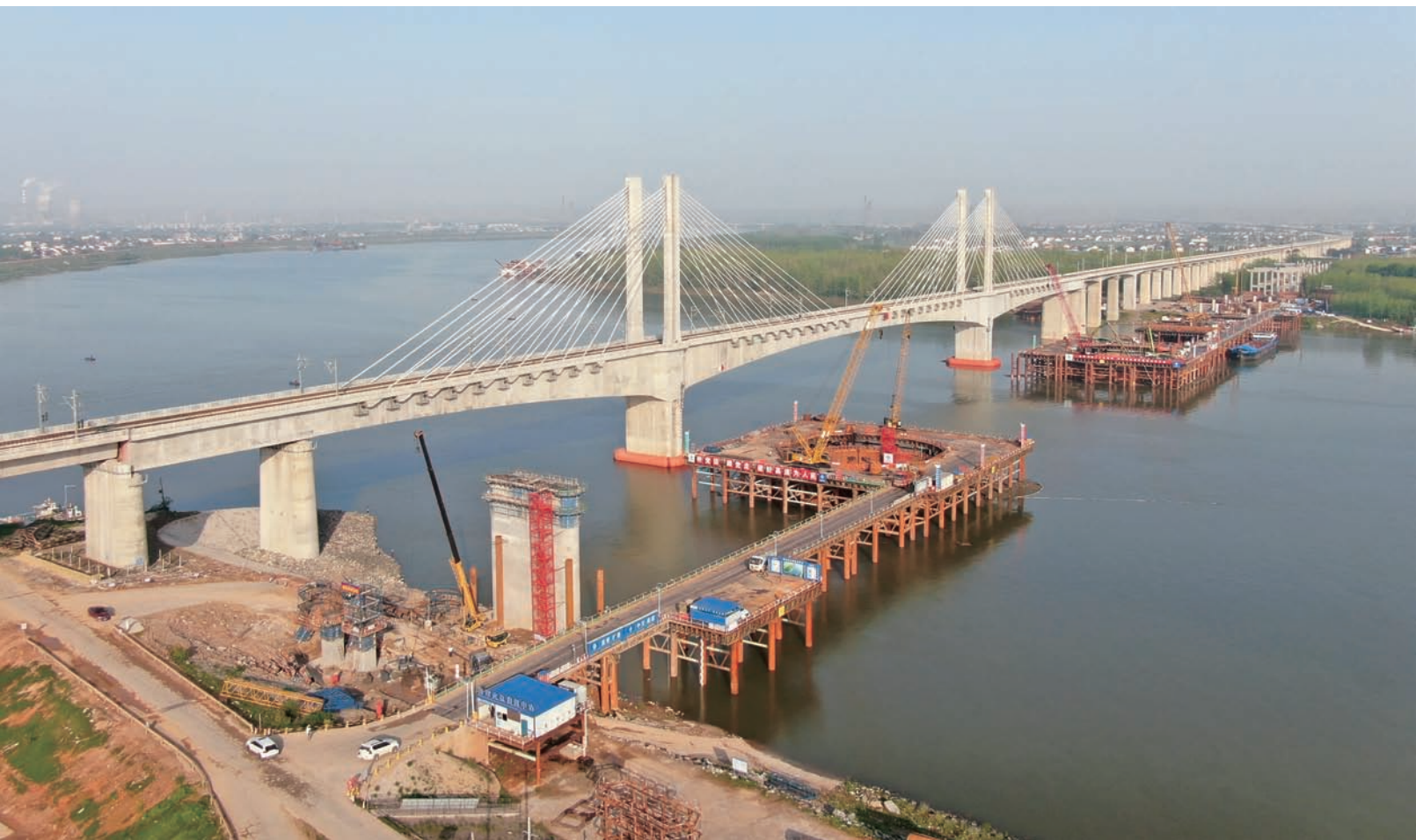
益常高速扩容工程沅水特大桥