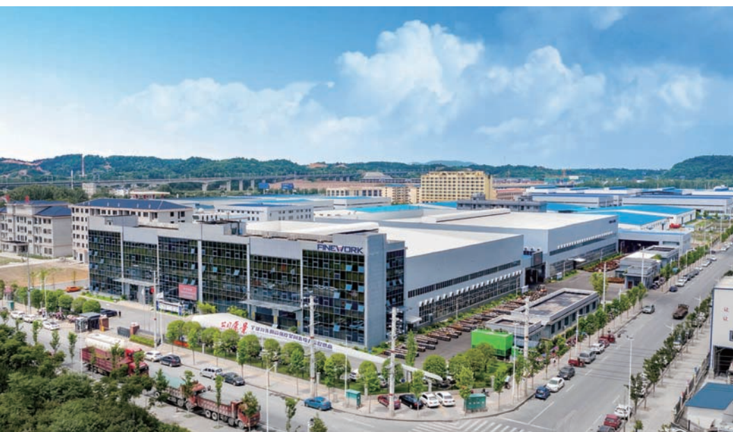
飞沃新能源科技股份有限公司

进落地”的招商闭环，紧紧围绕智能机械制造、电子信息主特产业体系，紧盯“三类500强”、央企国企、上市公司、行业领军企业，着力招引龙头链主型、科技创新型、专精特新型、补链强链型、外商外资型五大重点类