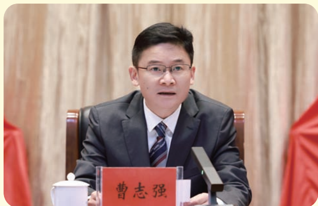
市委书记曹志强代表市委常委会作报告