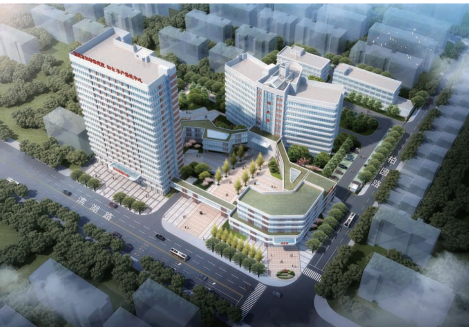
市妇幼保健院规划图

广大妇女儿童手中。一是落实省重点民生实事项目。2022年为全市的适龄妇女完成了免费宫颈癌和乳腺癌筛查，通过积极有效的干预治疗和跟踪随访，有力保障了广大妇女的生殖健康和生命安全；为全市18955名符合条件的孕产妇免费提供了产前筛查服务，有效避免了严重缺陷儿的出生；为全市19017名新生儿完成先天性心脏病筛查项目，有效的提