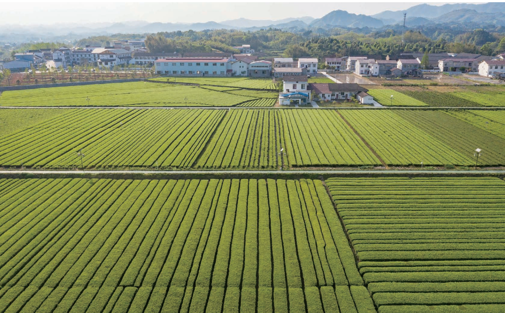
桃源县茶庵铺镇松阳坪村特色茶园