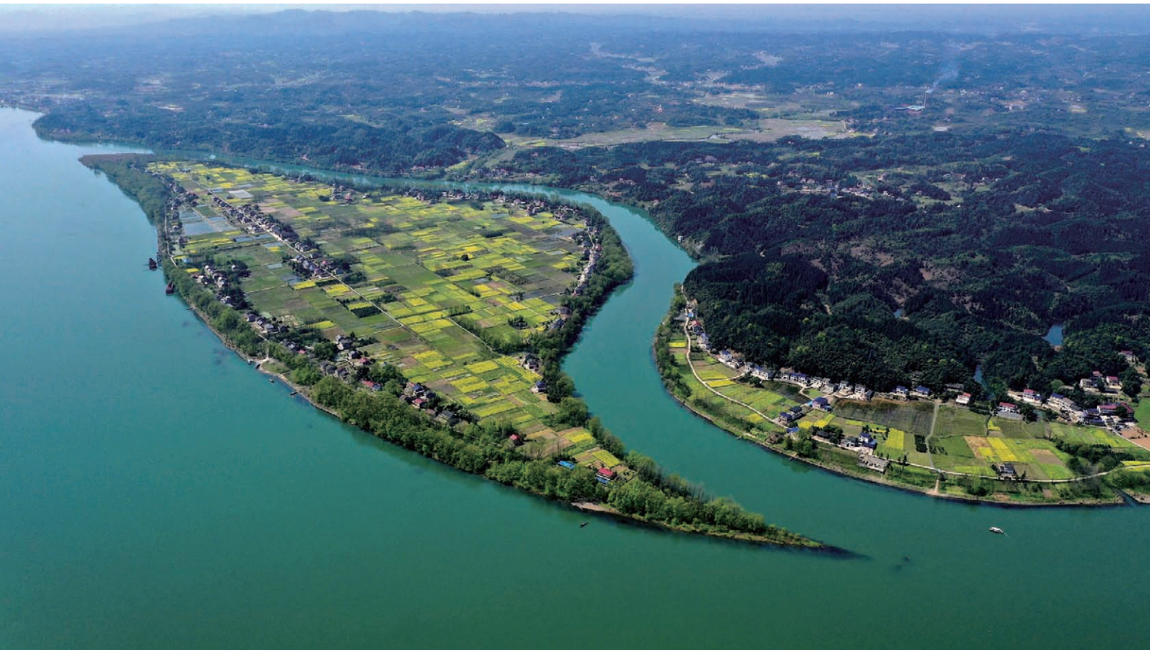
桃花源白鳞洲村鸟瞰