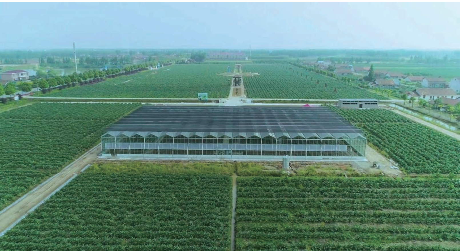
西洞庭朝鲜蓟产业基地