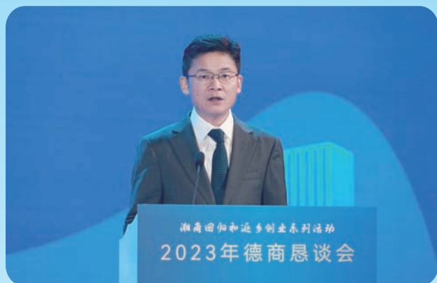
市委书记曹志强出席活动并讲话