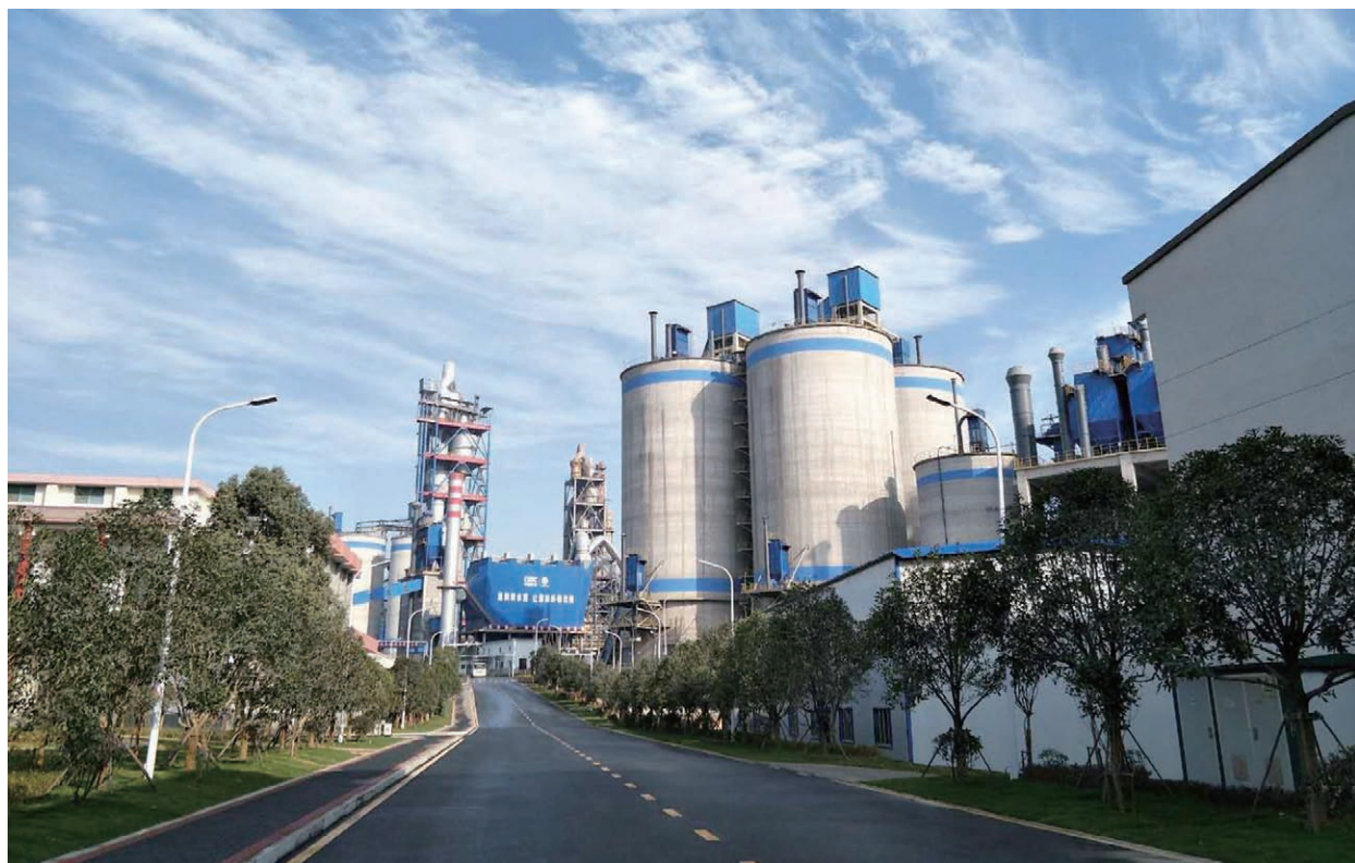
石门葛洲坝白水泥生产线建设工程