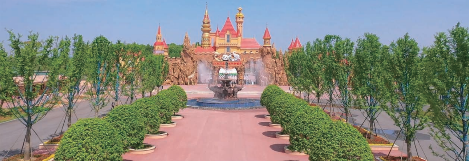
湖南常德野生动物世界