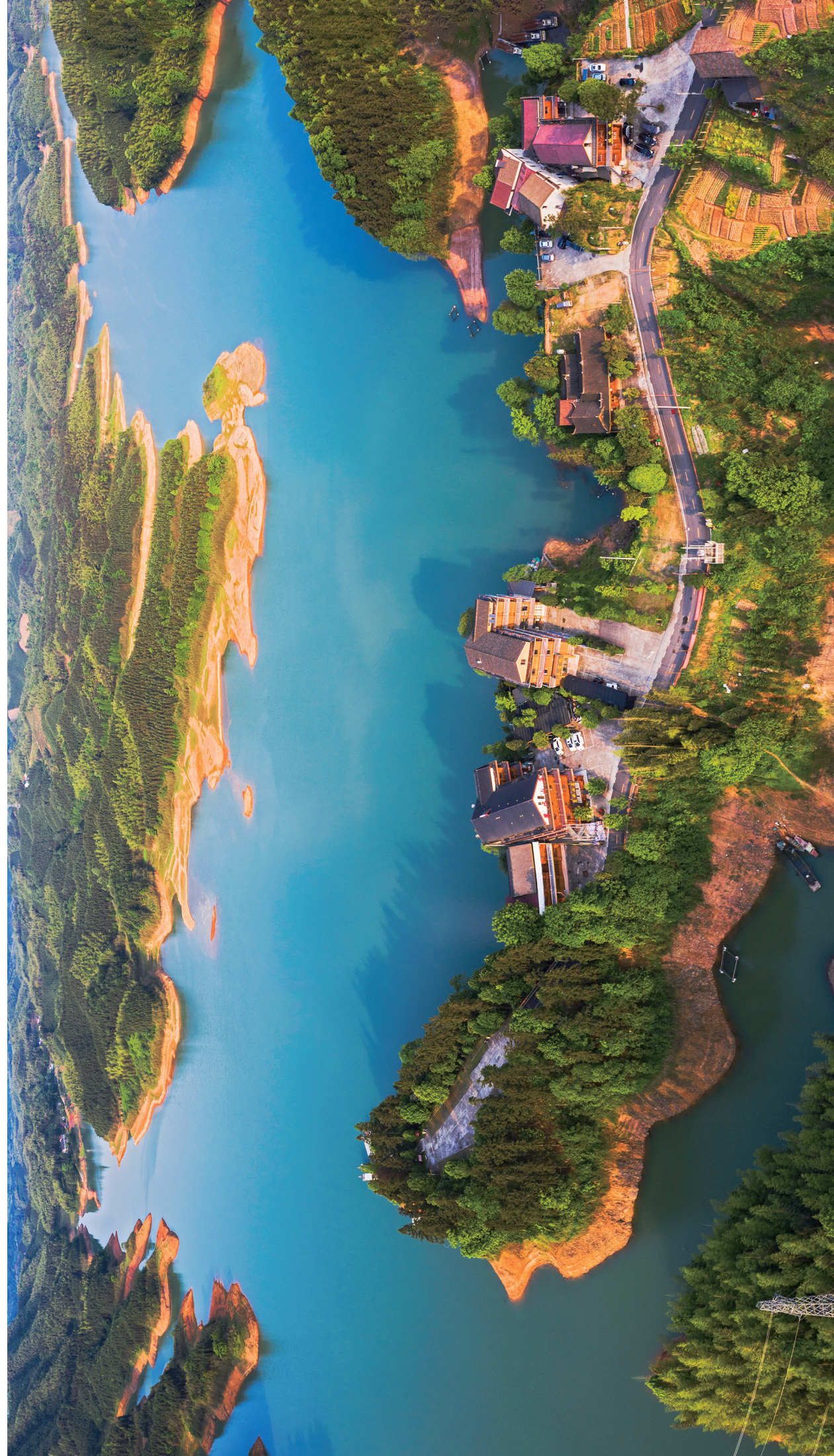
江南休闲胜地、中国白鹭之乡——花岗岩国家森林公园