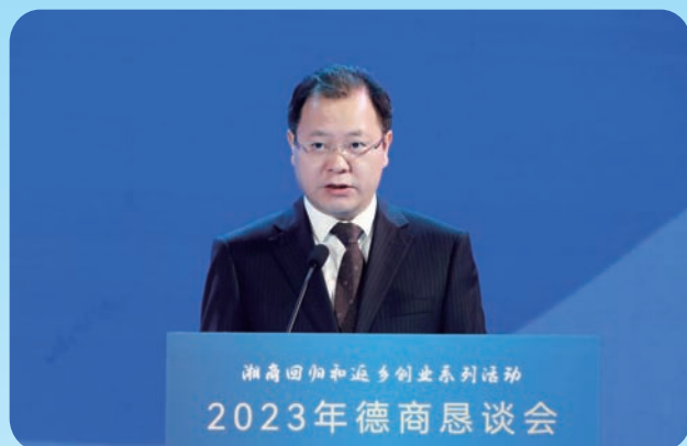
市委副书记、市长周振宇致辞

4月2日，2023年德商恳谈会举行，与会嘉宾和德商代表汇聚一堂，共话乡音、共叙情谊、共商发展。市委书记曹志强出席活动并讲话，市委副书记、市长周振宇致辞。