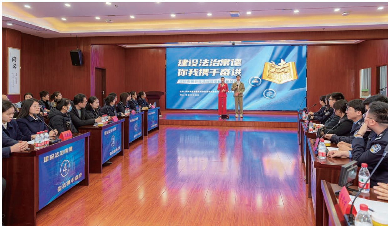
全市地方性法规规章知识抢答赛