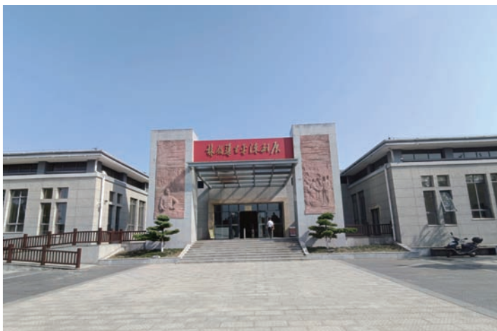
林伯渠生平陈列展馆