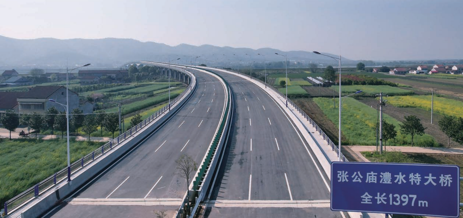
张公庙澧水特大桥