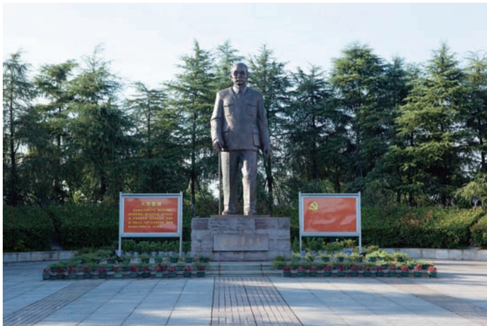
林伯渠铜像纪念广场