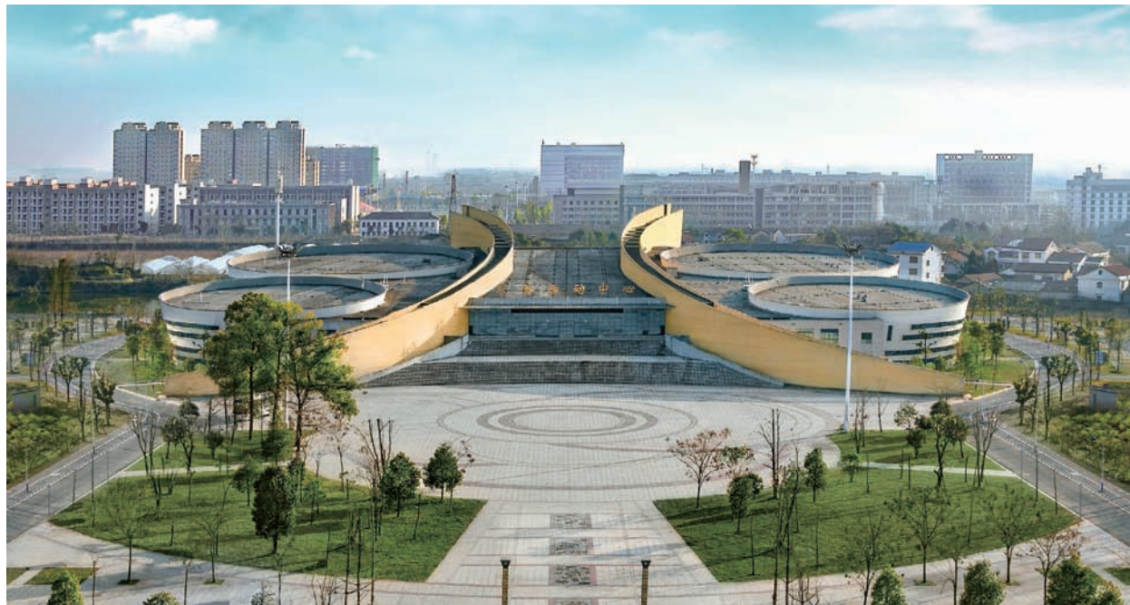
常德职院文体活动中心