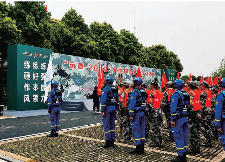
“沅澧——2023”军地联合指挥行动演练

工调度、巡堤防守、应急响应、指挥调度、转移避险、抢险救援、救灾救助、灾后重建、值班值守、信息报送等工作。